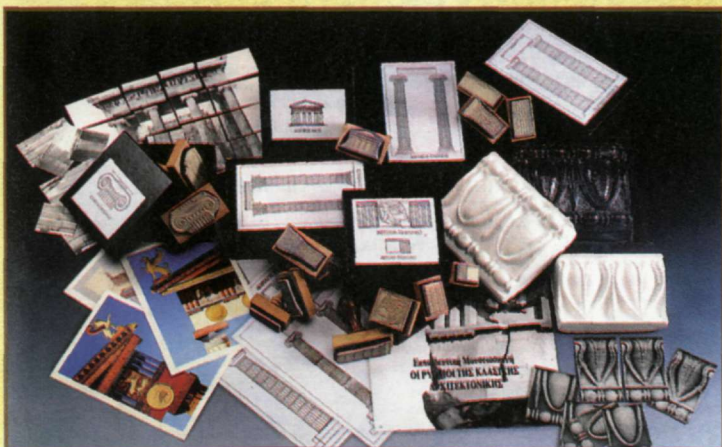
Η μουσειοσκευή "Οι Ρυθμοί της Κλασικής Αρχιτεκτονικής".

Κορνηλία Χατζηασλάνη Αρχιτέκτων - Αρχαιολόγος Υπεύθυνη Εκπαιδευτικών Προγραμμάτων Α' Εφορεία Προϊστορικών και Κλασικών Αρχαιοτήτων