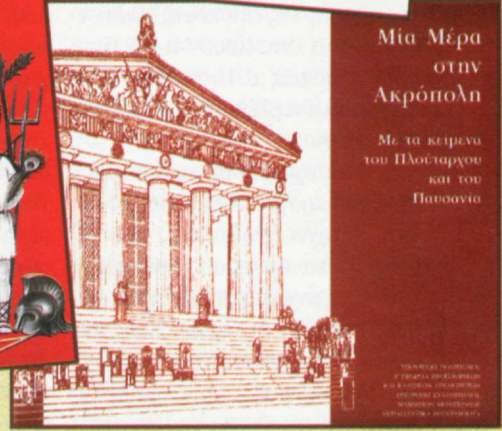
Μια Μέρα στην Ακρόπολη Με τα κείμενα του Πλούταρχου και του Πασανίου

ΥΠΟΥΡΓΕΙΟ ΠΑΙΔΕΙΑΣ ΚΑΙ ΘΡΗΣΚΕΥΜΑΤΩΝ ΕΠΙΧΕΙΡΗΣΙΑΚΟ ΠΡΟΓΡΑΜΜΑ «ΕΚΠΑΙΔΕΥΣΗ ΚΑΙ ΔΙΑ ΒΙΩΣΗΣ ΜΑΘΗΣΗ» ΠΡΟΤΥΠΟ ΚΑΤΑΣΤΑΣΗ ΕΚΠΑΙΔΕΥΤΙΚΩΝ ΚΕΝΤΡΩΝ