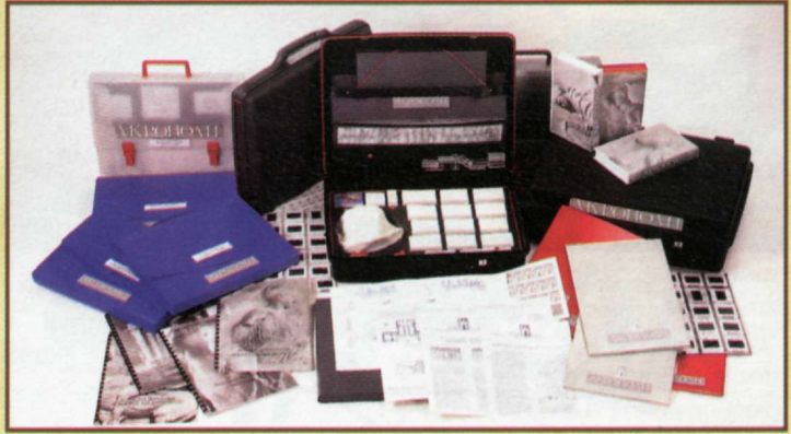
Το δανειστικό εκπαιδευτικό υλικό των μουσειοσκευών.

ΥΠΟΥΡΓΕΙΟ ΠΑΙΔΕΙΑΣ ΚΑΙ ΘΡΗΣΚΕΥΜΑΤΩΝ ΕΠΙΧΕΙΡΗΣΙΑΚΟ ΠΡΟΓΡΑΜΜΑ «ΕΚΠΑΙΔΕΥΣΗ ΚΑΙ ΔΙΑ ΒΙΩΣΗΣ ΜΑΘΗΣΗ» ΠΡΟΤΥΠΟ ΚΑΤΑΣΤΑΣΗ ΕΚΠΑΙΔΕΥΤΙΚΩΝ ΚΕΝΤΡΩΝ