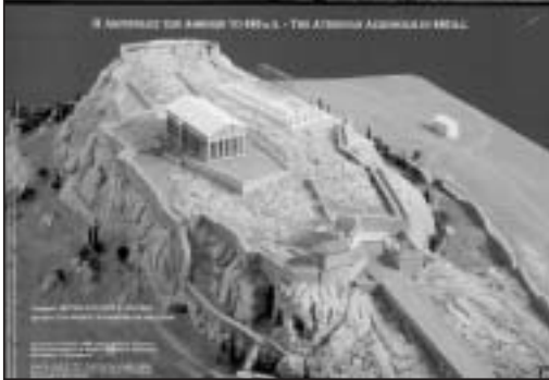
Η Ακρό- πολις των Αθηνών το 480 π.Χ.