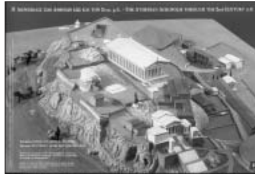
Η Ακρό- πολις των Αθηνών έως και τον 2ο αι. μ.Χ.