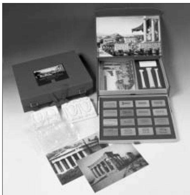
Μουσειοσκευή «Ένας Αρχαίος Ναός»

Από την πρώτη τους μορφή που υλοποιήθηκε στο πλαίσιο των εκπαιδευτικών προγραμμάτων της Ακρόπολης το 1990-1993, οι σημερινές μουσειοσκευές έχουν μετεξελιχθεί, έτσι ώστε να είναι πιο εύρηστες και να επιτρέπουν την πολλαπλή αναπαραγωγή τους, ανάλογα με τις ανάγκες που θα προκύψουν. Διακινούνται τόσο στην Ελλάδα, όσο και στο εξωτερικό και για τον λόγο αυτό το σύνολο των εντύπων έχει μεταφρασθεί και στην αγγλική γλώσσα. Το τμήμα μας μέχρι σήμερα δάνειζε 15 μουσειοσκευές σε περίπου 200 σχολεία τον χρόνο. Οι νέες μουσειοσκευές, μας έδωσαν για πρώτη φορά την ευκαιρία να τις προσφέρουμε σε εκπαιδευτικούς φορείς, αλλά και την ευχέρεια να τις δανείζουμε σε περισσότερα σχολεία τον χρόνο και για μεγαλύτερο χρονικό διάστημα.