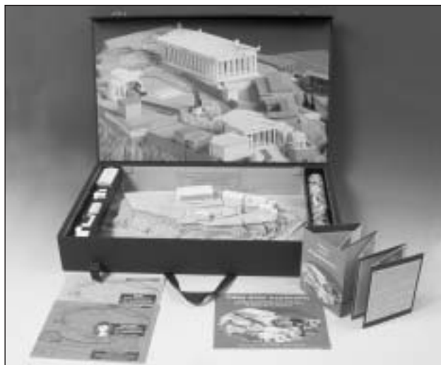
Μουσειοσκευή «Πάμε στην Ακρόπολη»

Τέσσερις αφίσες με την ιστορία του Βράχου, έντυπα για τον εκπαιδευτικό και τον μαθητή, με θέματα «Πάμε στην Ακρόπολη» και «Πάμε στον αρχαίο Περίπατο της Ακρόπολης» με αναπαράστασεις των μνημείων, των ιερών σπηλαίων και των θεάτρων τόσο κατά την κλασική εποχή όσο και σήμερα, βοηθούν τον μαθητή να ακολουθήσει ένα οδοιπορικό στον Βράχο και να αναπαραστήσει με τη φαντασία του το λαμπρό Ιερό,