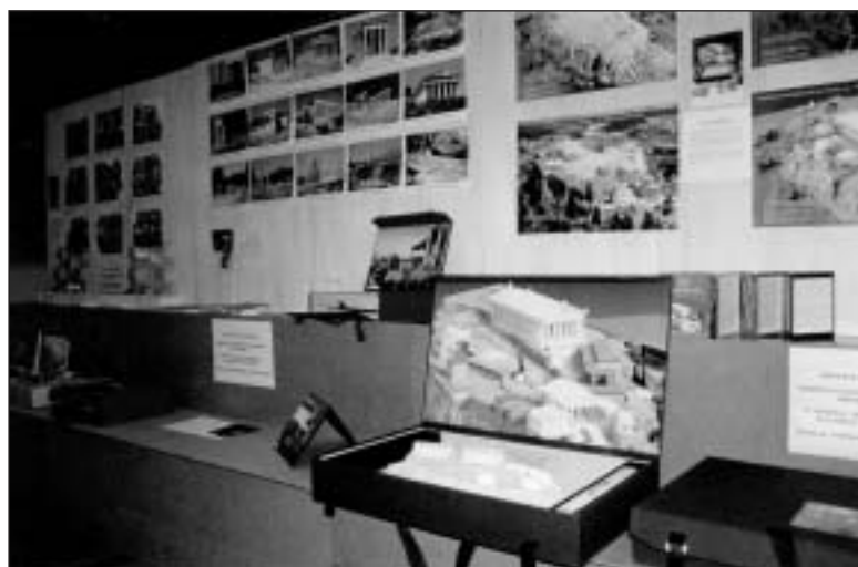
Εκθεση των μουσειοσκευών στο Κέντρο «Γαία» του Μουσείου Γουλανδρή Φυσικής Ιστορίας

Ήδη έχει ξεκινήσει η επόμενη φάση για να δοθούν στο εξωτερικό 100 αντίγραφα της αγγλικής έκδοσης της μουσειοσκευής «Πάμε στην Ακρόπολη», χάρη στη χορηγία του Ιδρύματος Σταύρος Σ. Νιάρχος. Οι 5 πρώτες μουσειοσκευές δόθηκαν στα μεγαλύτερα σχολεία του Βελγίου με το πιο έντονο ενδιαφέρον για τον ελληνικό πολιτισμό στις πόλεις Namur, Vise, Liege, Herstal, Mons. Τα σχολεία επιλέχθηκαν από το Υπουργείο