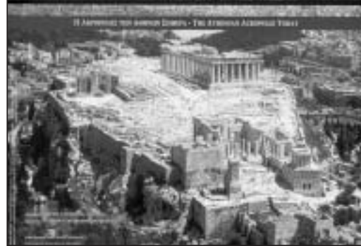
Η Ακρό- πολις των Αθηνών σήμερα

όπου οι Αθηναίοι λάτρευαν την προστάτιδα Θεά τους. Σχετική με την κατασκευή του αρχαίου ναού, είναι η δεύτερη μουσειοσκευή με τίτλο « Ένας Αρχαίος Ναός » που πραγματοποιήθηκε με τη χορηγία του Ιδρύματος Μποδοσάκη. Ανοίγοντας τη μουσειοσκευή βλέπει κανείς τον γνωστό πίνακα του Schinkel που αποδίδει μία φανταστική-ποιοτική προσέγγιση ναού και ελληνικού τοπίου. Ένα αντίγραφο του Παρθενώνα σε κλίμακα 1:800 δείχνει στους μαθητές με παραστατικό τρόπο πώς ήταν ένας αρχαίος ναός. Αντίγραφα κιόνων των τριών ρυθμών της κλασικής αρχιτεκτονικής βοηθούν τα παιδιά να παρατηρήσουν και να αναγνωρίσουν τις επιμέρους μορφές των ρυθμών, να τους συγκρίνουν μεταξύ τους και να κατανοήσουν τα χαρακτηριστικά τους. Σε ένα συρτάρι υπάρχουν 16 σφραγίδες με τη βοήθεια των οποίων οι μαθητές μπορούν να συνθέσουν τον Δωρικό, τον Ιωνικό και τον Κορινθιακό ρυθμό.