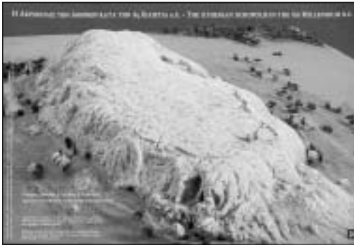
Η Ακρό- πολις των Αθηνών κατά την 4η χιλιετία π.Χ.