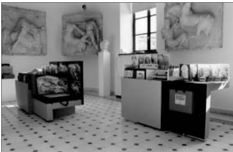
Έκθεση των μουσειοσκευών στο Κέντρο Μελετών Ακροπόλεως