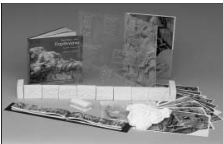
Μουσειοσκευή «Η Ζωφόρος του Παρθενώνα»

Με βάση το παραπάνω σκεπτικό αλλά και τη σπουδαιότητα που αποδίδει η Υπηρεσία μας στη λειτουργία των βιβλιοθηκών ως κύριων πολιτιστικών κεντρών της περιφέρειας, αρκετές από τις μουσειοσκευές μας δόθηκαν σε βιβλιοθήκες, δημόσιες, με κινητές μονάδες, σε βιβλιοθήκες του δικτύου του Κέντρου Παιδικού και Εφηβικού Βιβλίου καθώς και του δικτύου βιβλιοθηκών του νομού