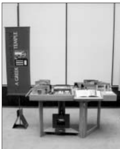
Έκθεση των μουσειοσκευών στις Βρυξέλλες