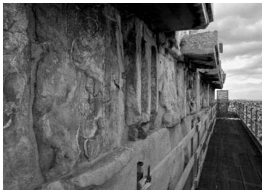
Οι δυτικές μετώπες του Παρθενόνος. Άποψη από Β. Ιούνιος 2007