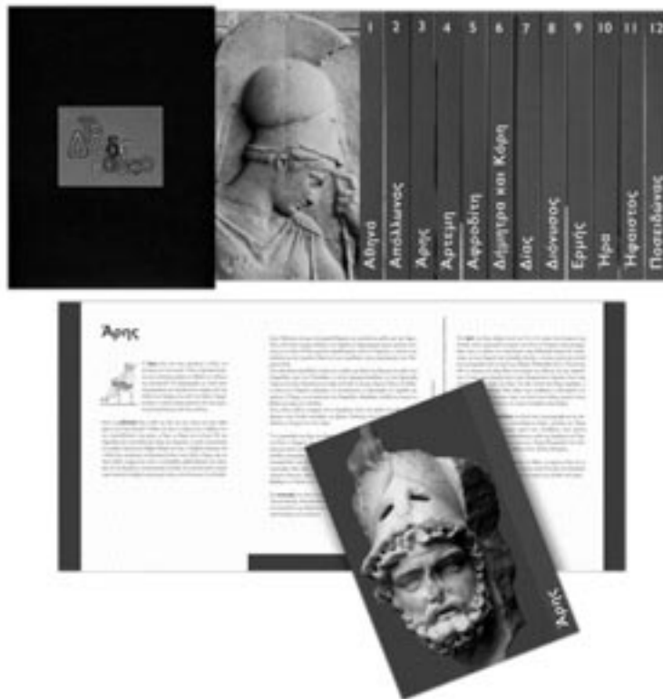
Τα έντυπα της μουσειοσκευής «Το Δωδεκάθεο». Φωτ. Σ. Μαυρομάτης, 2007

Τομέας Ενημέρωσης και Εκπαίδευσης της ΥΣΜΑ