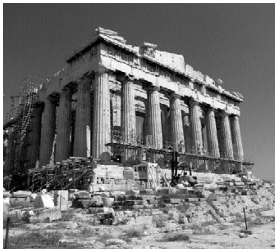
Η δυτική όψη του Παρθενόνος με την ειδικά πλατφόρμα αυτοψίας και μελέτης. Ιούνιος 2007

Ενημερωτική περιοδική έκδοση της Υπηρεσίας Συντήρησης Μνημείων Ακρόπολης (ΥΣΜΑ) του Υπουργείου Πολιτισμού