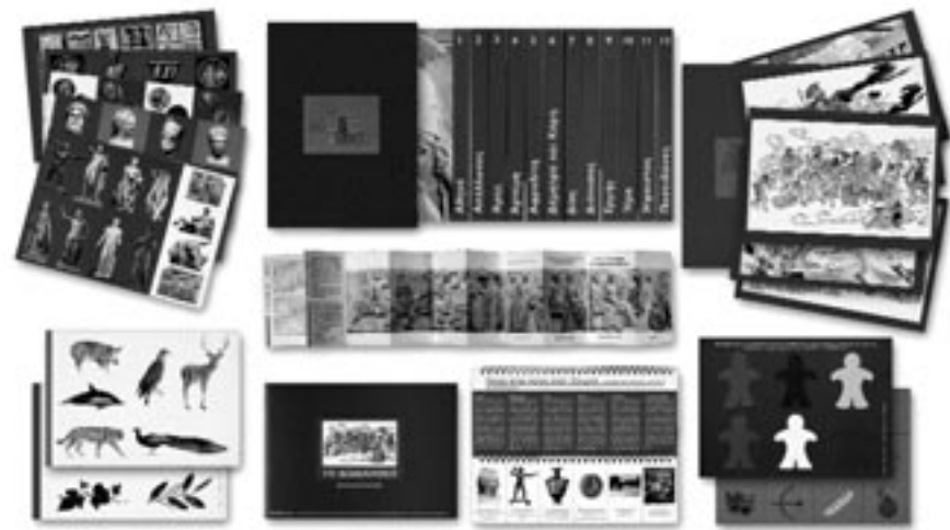
Η εκπαιδευτική μουσειοσκευή «Το Δωδεκάθεο». 2007

Αναγνωρίζοντας τους θεούς... σε αγγεία Στην καρτέλλα αυτή υπάρχουν δώδεκα αρχαία αγγεία. Στο κάθε ένα απεικονίζονται σκηνές με πρωταγωνιστή έναν θεό. Οι μαθητές αναγνωρίζουν τον κάθε θεό από τα