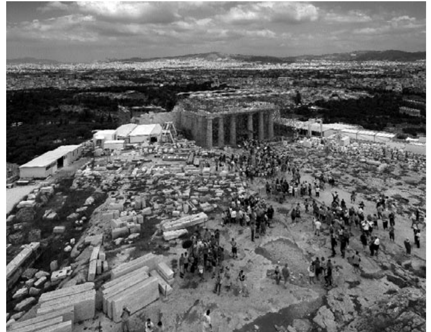
Αποψη των Προπυλαίων και της περιβάλλουσας περιοχής από τη στάθμη των μετωπών του Παρθενώνος. Φωτ. Σ. Μαυρογιάννης, Ιούνιος 2007

Χ. Μπούρας, Θεωρητικές αρχές των επεμβάσεων στα μνημεία Ακρόπολεως Μ. Ιωαννίδου, 2000-2007, το αναστηλωτικό έργο της ΥΣΜΑ στην Ακρόπολη Φ. Μαλλούχου-Τυφάνο, Ε. Πετροπούλου, Έρευνα κοινής γνώμης για την αναστήλωση της Ακρόπολης Γ. Εγγλέζος, Επεμβάσεις προστασίας αρχαίων μνημείων με τη μέθοδο της κατάχωσης, Η περίπτωση του Αρρηφορίου Οίκου στην Ακρόπολη των Αθηνών Ε. Λεμπιδάκη, Με την ευκαιρία της νέας αναστήλωσης του ναού της Αθηνάς Νίκης, Αναδρομή στην ιστορία του λατρευτικού αγάλματος της θεάς Κ. Χατζηασλάνη, Ε. Καϊμάρα, Α. Λεοντί, Η νέα εκπαιδευτική μουσειοσκευή «Το Δωδεκάθεο» Φ. Μαλλούχου-Τυφάνο, Τα νέα της Ακρόπολης Φ. Μαλλούχου-Τυφάνο, Η αποκατάσταση του Ερεχθείου: μετά 20 έτη