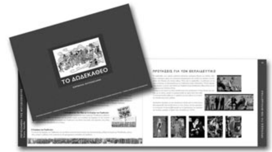
Το βιβλίο της μουσειοσκευής «Το Δωδεκάθεο». Φωτ. Σ. Μαυρομμάτης, 2007

Έτσι, μετά από 10 χρόνια, και χάρη στην ευγενική χορηγία του Ιδρύματος Σταύρος Νιάρχος, εξελίξαμε το περιεχόμενο και τη