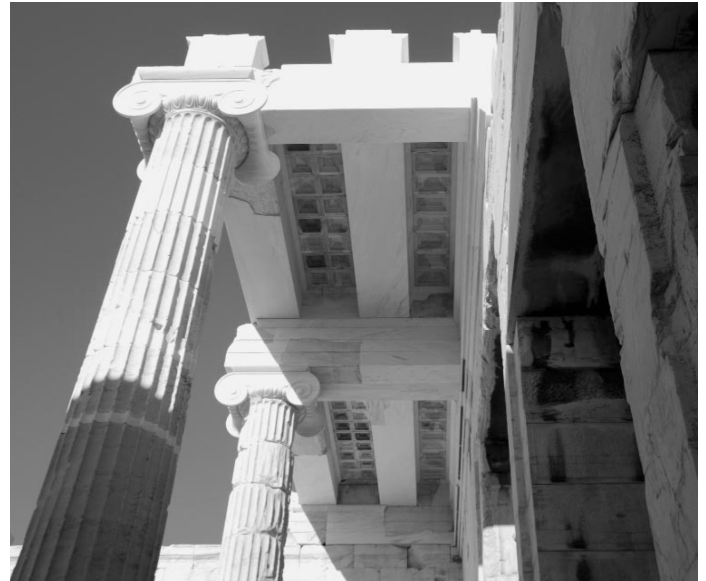
Η αναστηλωμένη οροφή της δυτικής αίθουσας των Προπυλαίων. Φωτ. Τ. Τανούλας, Δεκέμβριος 2008

Χ. Μπούρας, Αυστηρή και χαλαρή τήρηση αρχών στις αναστηλώσεις των αρχαίων μνημείων στην Ελλάδα Μ. Ιωαννίδου, 2008-2009, Η πρόοδος των αναστηλωτικών έργων στην Ακρόπολη Μ. Ιωαννίδου, Στρατηγικές για την αντισεισμική προστασία των Μνημείων Ακρόπολεως Ρ. Χριστοδουλοπούλου, Η μελέτη αναστήλωσης του ανώτερου θρηγικού της βόρειας περιστεσης του Παρθενώνα Ε. Καρακίτσου, Τα παιχνίδια στον Παρθενώνα Κ. Χατζηασλάνη, Ε. Καϊμάρα, Α. Λεοντί, www.parthenonfrieze.gr Φ. Μαλλούχου-Τυφάνο, Τα νέα της Ακρόπολης