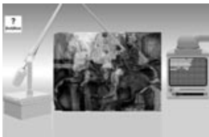
«Παίξτε με τη ζωφόρο». Παιχνίδι: «γίνε συντηρητής»

Στο παιχνίδι «Συνθέτω τη δυτική ζωφόρο» τα παιδιά προσπαθούν να βρουν τη σωστή θέση των 16 λίθων της δυτικής ζωφόρου, που εικονίζουν την προετοιμασία της πομπής των ιππέων κατά τα Μεγάλα Παναθήναια. Κάθε λίθος εμφανίζεται με τυχαία σειρά στο κέντρο της οθόνης. Ο χρήστης παρατηρεί τον λίθο και στη συνέχεια προσπαθεί να βρει για ποιον από τους δεκαέξι πρόκειται, διαβάζοντας μία μικρή περιγραφή για κάθε λίθο που εμφανίζεται στο επάνω μέρος της οθόνης με τον αντίστοιχο αριθμό του. Όταν ο χρήστης συνδυάσει σωστά την εικόνα με το κείμενο, τότε ο λίθος βρίσκει τη