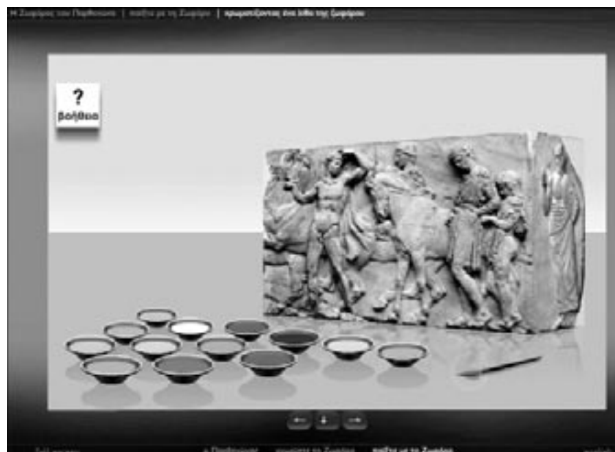
«Παίξτε με τη ζωφόρο». Παιχνίδι: «χρωματίζοντας ένα λίθο της ζωφόρου»

ήσουν ένα ομοίωμα του λέιζερ, με το οποίο έχει γίνει ο καθαρισμός των λίθων. Δίνεται στα παιδιά ένας λίθος από τη ζωφόρο για να τον καθαρίσουν με λέιζερ. Με τον δρομέα μετακινούν την κεφαλή του μηχανήματος και τη μεταφέρουν στην επιφάνεια του λίθου καθαρίζοντάς τον σταδιακά. Όταν ολοκληρώσουν με επιτυχία το έργο τους στο μόνιτορ, που εμφανίζεται στη δεξιά περιοχή της οθόνης, παρακολουθούν ένα βίντεο με την πραγματική διαδικασία καθαρισμού του λίθου από τους ειδικούς συντηρητές της ΥΣΜΑ. Στη συνέχεια έχουν τη δυνατότητα να παρακολουθήσουν ένα ακόμα μικρό βίντεο με θέμα την ιστορία της φθοράς του λίθου. Παρουσιάζονται τρεις φάσεις της φθοράς καταλήγοντας στη μορφή του λίθου πριν τον καθαρισμό του.