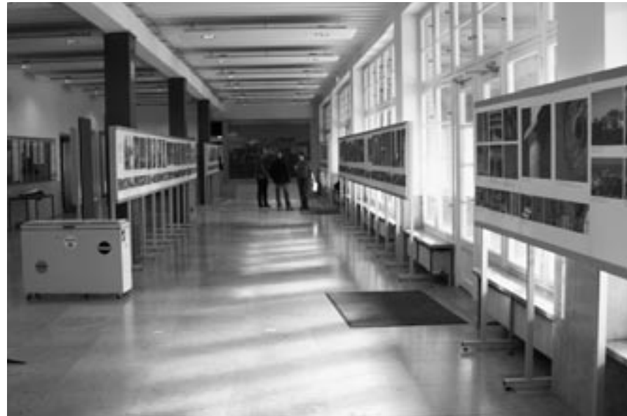
Φωτογραφική έκθεση των αναστηλωτικών έργων Ακροπόλεως στο Πανεπιστήμιο της Χαϊδελβέργης, Οκτώβριος 2008-Ιανουάριος 2009

ing the Acropolis of Athens. From Classical, Ancient Greece to Modern Olympics» περιλήφθηκε στο διεθνές συνέδριο «The International Archives of the Photogrammetry, Remote Sensing and Spatial Information»,