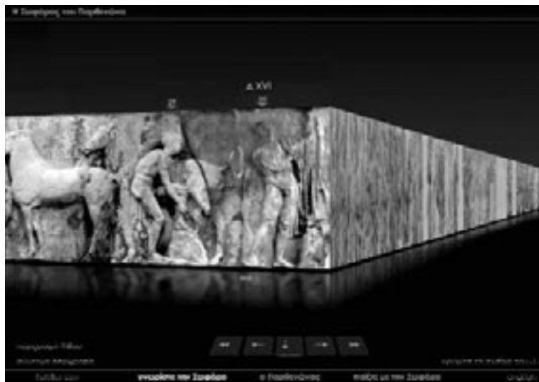
Ηλεκτρονική εφαρμογή «Γνωρίστε τη Ζωφόρο»: μετάβαση από τη δυτική στη νότια πλευρά