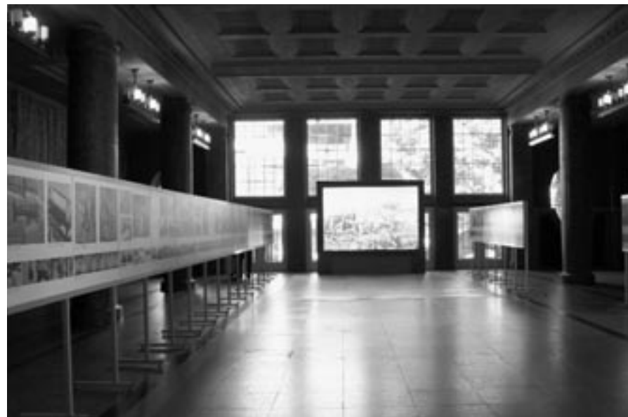
Φωτογραφική έκθεση των αναστηλωτικών έργων Ακροπόλεως στο Πανεπιστήμιο του Freiburg, Απρίλιος-Ιούνιος 2009

που οργανώθηκε από το ISPRS (International Society of Photogrammetry and Remote Sensing) από τις 3 έως 11 Ιουλίου 2008 στο Πεκίνο. Στη συνεδρία αυτή έγιναν οι ακόλουθες ανακοινώσεις: Δ. Μουλλού, Δ.