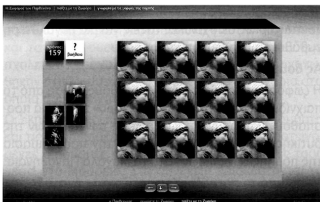
«Παίξτε με τη ζωφόρο»: παιχνίδι: γνωριμία με τις μορφές της πομπής.