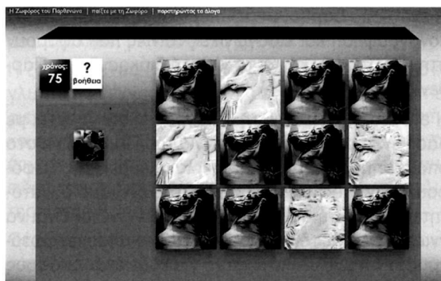
«Παίξτε με τη ζωφόρο»: παιχνίδι: παρατηρώντας τα άλογα.