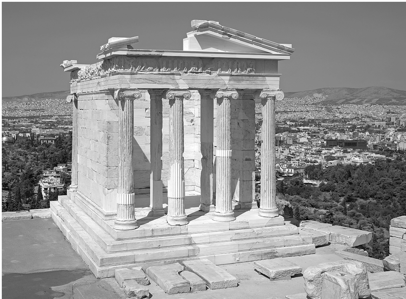
Άποψη του αναστηλωμένου ναού της Αθηνάς Νίκης, από Α. 2010