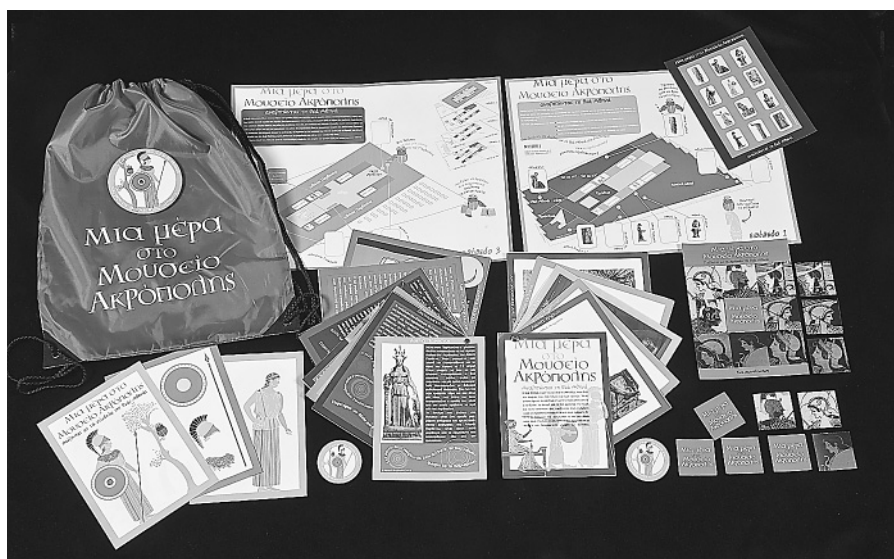
Δανειστικό σακίδιο.

Στο πλαίσιο αξιολόγησης αυτής της δραστηριότητας δημιουργήθηκε ερωτηματολόγιο, το οποίο συμπλήρωναν οι γονείς ό-