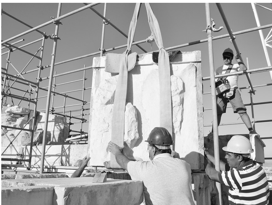
Αποσυναρμολόγηση της δεύτερης από δυτικά μετόπης του βόρειου θριγκού του Παρθενώνα. Φωτ. Β. Ελευθερίου, 2011

Ενημερωτική περιοδική έκδοση της Υπηρεσίας Συντήρησης Μνημείων Ακρόπολης (ΥΣΜΑ) του Υπουργείου Πολιτισμού και Τουρισμού (ΥΠΠΟΤ)