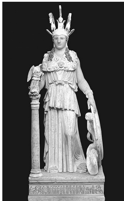
Ψηφιακή αναπαράσταση χρυσελεφάντινου αγάλματος Αθηνάς Παρθένου

στη θεά που παριστάνουν την ίδια, όπως η Αθηνά του Αγγέλτου, η Αθηνά που κατασκεύασε ο περίφημος γλύπτης Ένδοιος, η μικρή χάλκινη Αθηνά Πρόμαχος, θεά της