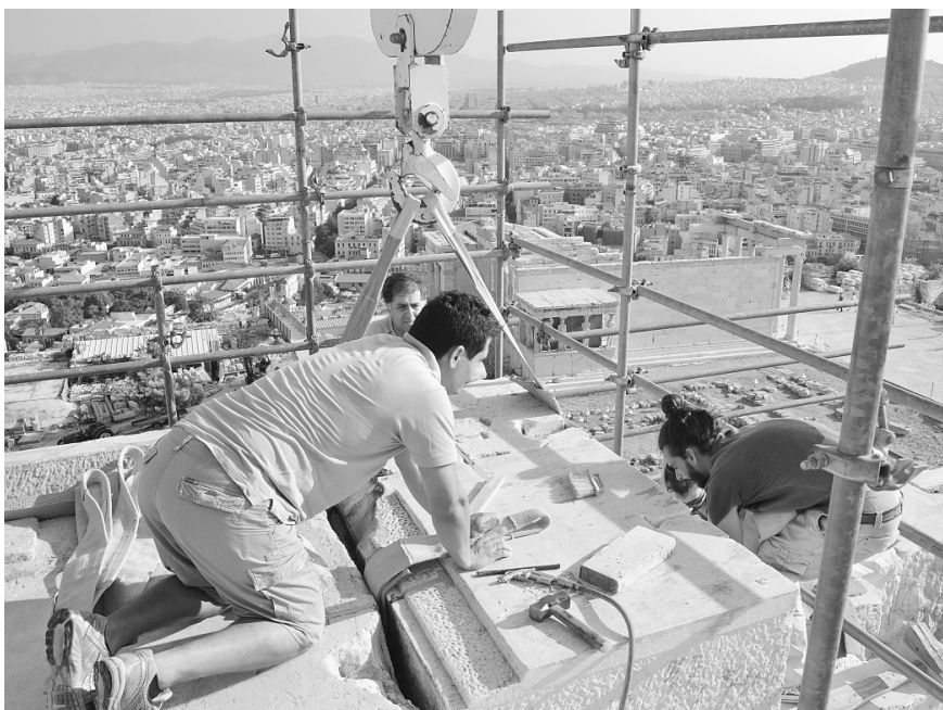
Προεργασίες για την αποσυναρμολόγηση λίθου γείσου από το βόρειο θριγκό του Παρθενώνα. Φωτ. Β. Ελευθερίου, 2011