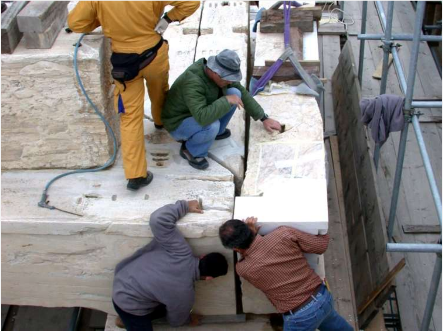
Ανατοποθέτηση επιστυλίου του Παρθενώνα.