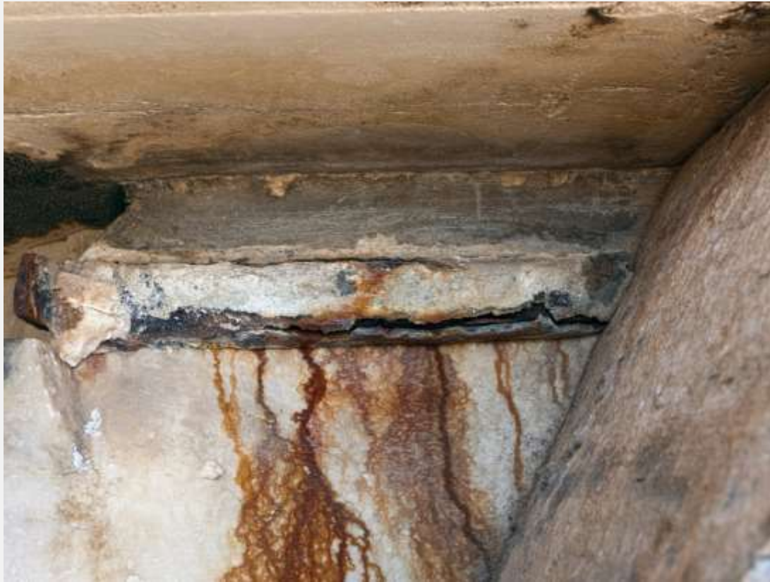
Σκουριά που προκλήθηκε από οξείδωση σιδερένιου συνδέσμου