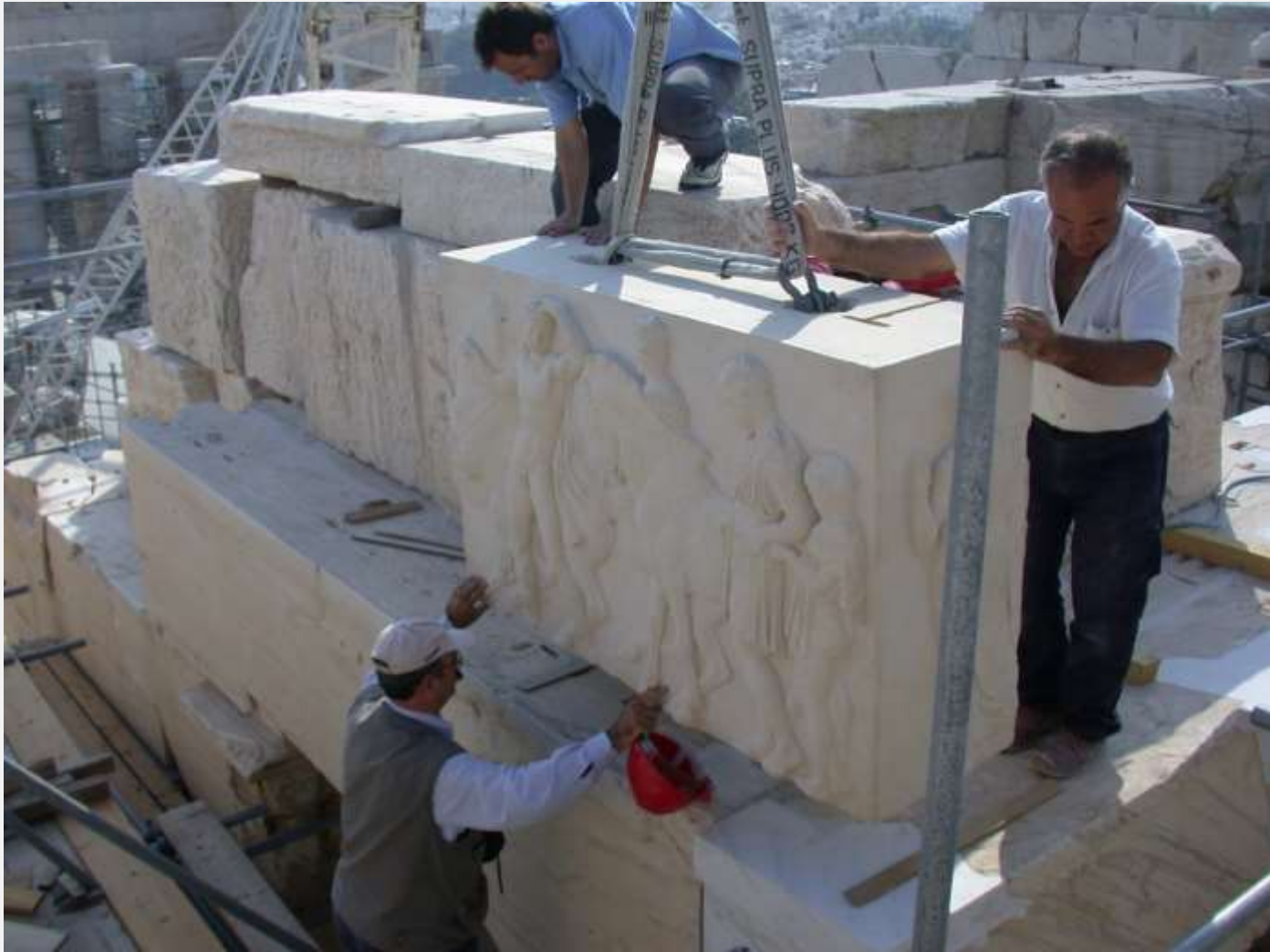
Ανατοποθέτηση αντιγράφου της δυτικής ζωφόρου του Παρθενώνα.