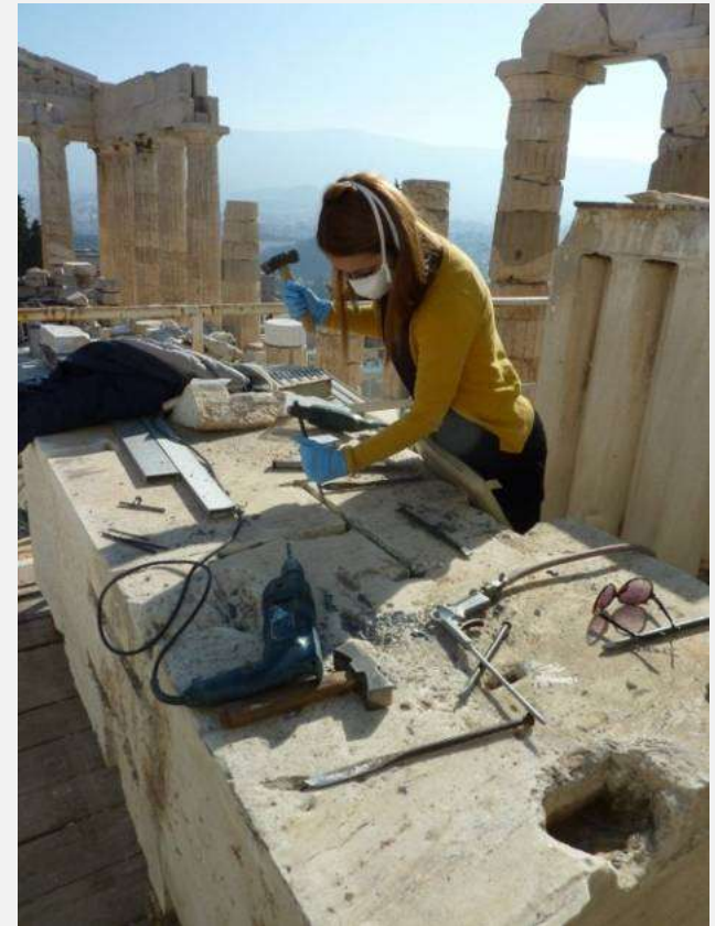
Αφαίρεση οξειδωμένων σιδερένιων συνδέσμων παλαιών αναστηλώσεων