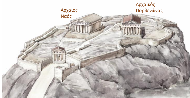
©Μουσείο Ακρόπολης. Σχέδιο υποθετικής αναπαράστασης: Α. Νίκας

Την εποχή αυτή υπάρχουν δύο πολύ εντυπωσιακοί ναοί αφιερωμένοι στη θεά Αθηνά, ο «αρχαϊκός Παρθενώνας» ή Εκατόμπεδος και ο Αρχαίος Ναός.