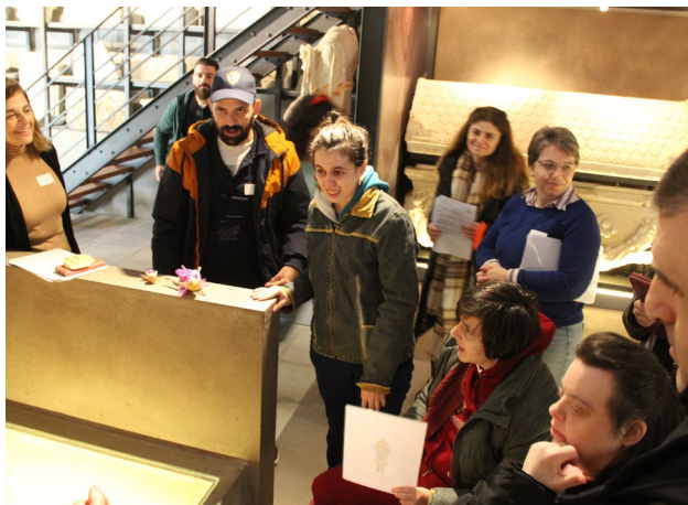
Τα παλιά χρόνια στη Νικόπολη, εκπαιδευτική δράση για ομάδα με νοητική αναπηρία.

δημιουργία εποπτικού υλικού rīaf σε συνεργασία με τον Φάρο Τυφλών, που περιλαμβάνει χάρτη της βυζαντινής Αθήνας, κάτοψη του ναού της Καπνικαρέας και χάρτη της σύγχρονης Αθήνας προκειμένου να αναδειχθεί η θέση της Καπνικαρέας σε σχέση με άλλα σημαντικά τοπόσημα της πόλης (Βουλή, Φωταέριο/Τεχνόπολις, Ακρόπολη).